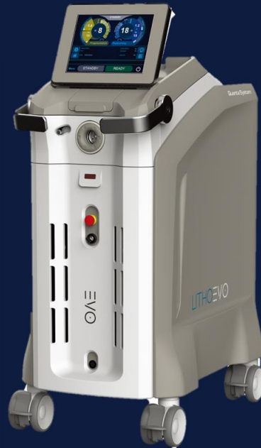
Litho EVO 35W

Quanta Litho EVO レーザ 承認番号：30200BZX00398000